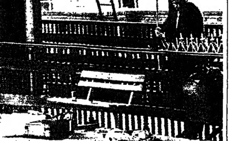
مكان الهجوم على الجنود في محطة السكة الحديد في بريطانيا

اعلن الجيش الجمهوري الايرلندي مسؤوليته امس السبت عن مقتل جنديين بريطانيين في هجومين وقعوا في ألمانيا الغربية ومحطة للسكك الحديدية في بريطانيا